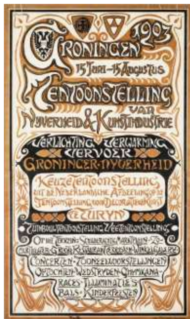
Affiche 'Groningen 1903, Tentoonstelling van nijverheid en kunstindustrie', Ontwerper onbekend (initialen F.H.B.), 1903, Collectie ReclameArsenaal (KABK) In 2018 te zien in het Noordelijk Scheepvaartmuseum tijdens de expositie 'Made in Stad: stoelen van meubelfabriek J.A.Huizinga'

De stukken uit het RA-archief zijn als bruikleen aan te vragen. In 2018 heeft het ReclameArsenaal onder andere meegewerkt aan bruiklenen aan het Amersfoortse Museum Flehite, Museum More, Museum Boijmans van Beuningen, en het Noordelijk Scheepvaartmuseum in Groningen.